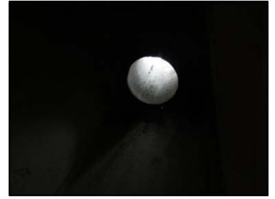
Photo N° 617 AMIANTE CIMENT -- Gaine technique 3 Gaines & coffres verticaux Ventilation haute (Fibres- ciment)