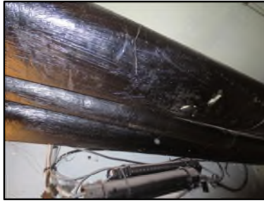
Photo N° 616 ECH-N°2 CALORIFUGEAGE --COULOIR DE CAVE Conduits de fluide Laine minérale + enveloppe bituminée