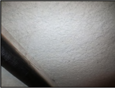
Photo N° 614 ECH-N°1 FLOCAGE -- COULOIR DE CAVE Plafonds blanc cotonneux

Dossier n°: 2013-09-300 FK DTA PC_087LAE_OPH